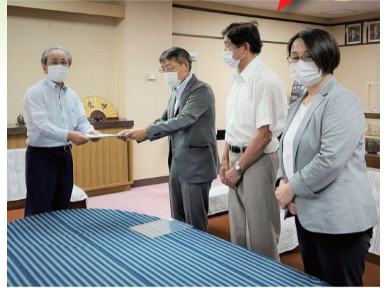
議長へ予算修正案を提出 6月11日