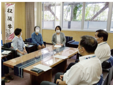
学校トイレに生理用品常備を目指して!

終活をエンディングノートに託す事業が始まりました。 「もめんノート」が無料配布されています。