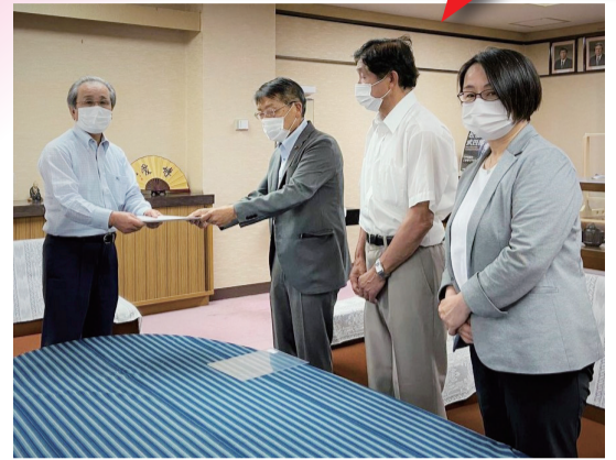
議長へ予算修正案を提出 6月11日