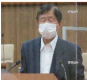
一般質問で6回取り上げました

高齢になって車に乗れなくなったとき、予約すれば家まで送迎してくれるデマンド交通がどうしても必要です。市長もやっとこれをやると明言しました。一日も早く実現するために頑張ります。