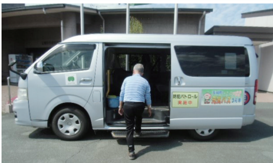
玉城町のオンデマンドバス