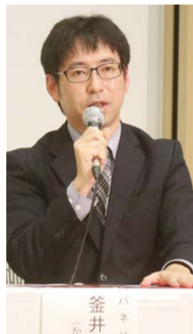
伊賀・市長選公開討論会で

生まれ育った伊賀市を、人と自然が大切にされるハートフルなまちにしたい。そんな想いで、11月の市長選挙に挑戦をしました。当選にはおよびませ